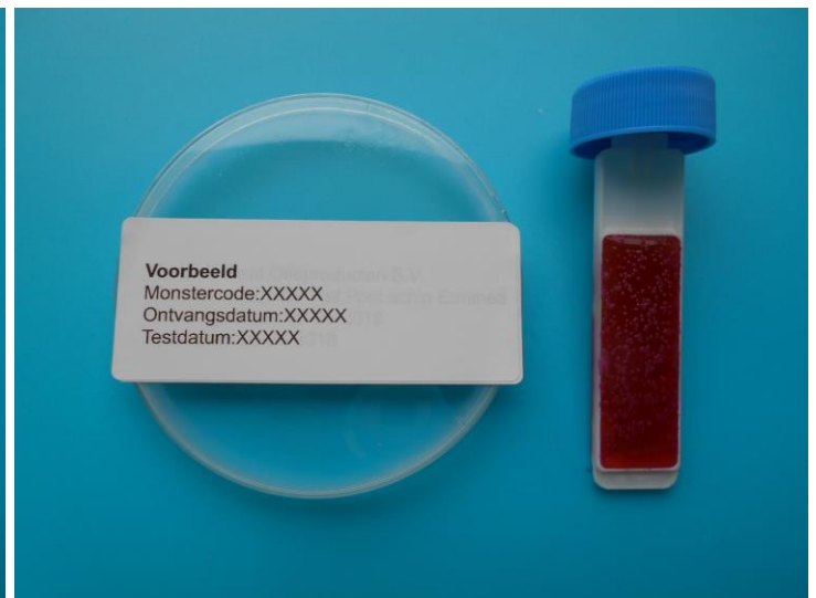
Schimmels en Gisten